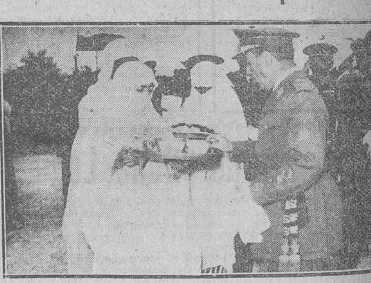
Kabila de Beni Osmar (Tetuán). — El Alto Comisario de España en Marruecos, teniente general García Valiño, recibe de las musulmanas de la kabila la ofrenda de leche, miel y dátiles, a su llegada para asistir a la inauguración de una de las cincuenta escuelas en los territorios de esta zona, según el plan trienal de la Alta Comisaría.