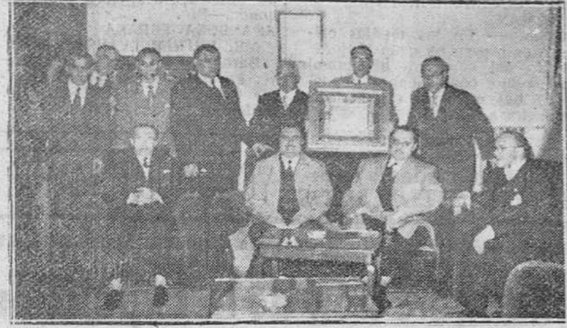
El gobernador civil y el alcalde de la ciudad, fotografiados con los presidentes de las Peñas burgalesas...

El acto constituyó un bello exponente de gratitud y de burgalesismo