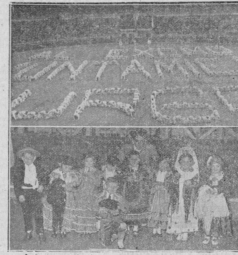
Tres momentos del brilliantísimo festival gimnástico - deportivo presentado por segunda vez en años consecutivos...

Fué ofrecido como homenaje al Excmo. Ayuntamiento de Burgos. La plaza de toros estuvo totalmente llena de público