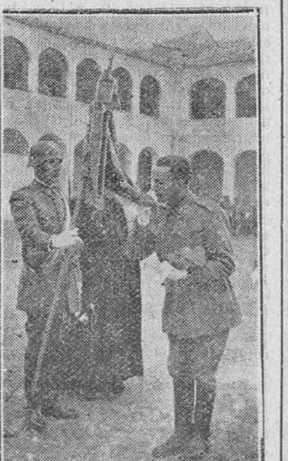
Un momento de la solemne jura de bandera celebrada en el cuartel de Caballería...

Los actos se celebraron en diversos cuarteles de la guarnición y en los campamentos de Cubillo del Campo y Miranda de Ebro