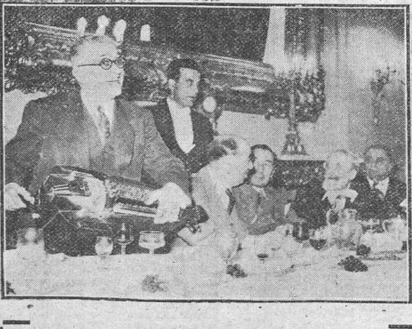
Madrid. — Con motivo de cumplir su 85 aniversario, el insigne historiador don Ramón Menéndez Pidal, fue objeto de un homenaje organizado por los Centros gallego y asturiano, al que se sumaron las demás Casas regionales de Madrid, entre ellas la "Mesa de Burgos", que ostentó la representación de nuestra Corporación municipal. Al final del acto y tal como muestra la fotografía, homenajeado y personalidades que asistieron al acto, escucharon un concierto de zampona.