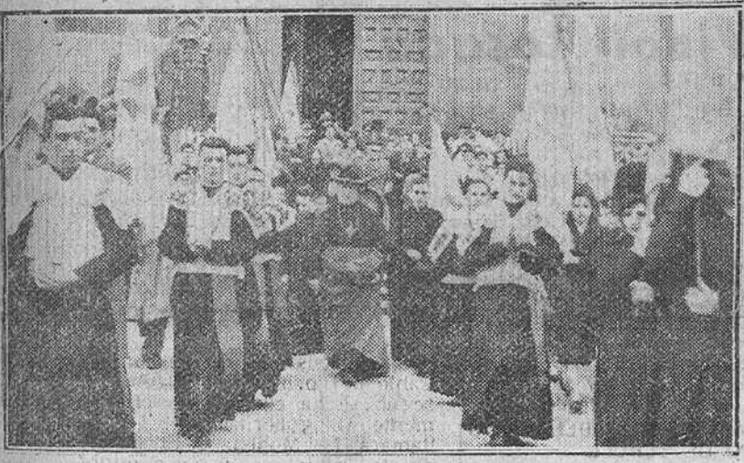
En la parte superior, el Nuncio Apostólico en Madrid, monseñor Antoniutti, saliendo de la Catedral madrileña, después de asistir al solemne Te Deum, celebrado con motivo del Día del Papa. En la fotografía inferior, nuestro Rvdmo. Prelado, al abandonar el Santo Templo Metropolitano, escoltado por seminaristas y las banderas de Acción Católica, después de presidir los solemnes actos que tuvieron lugar en la Catedral.

obispo de Ereso, los obispos auxiliares, el Tribunal de la Rota en pleno y el Cabildo catedralicio. Ante el presbiterio se situaron los ministros de Asuntos Exteriores, Educación, Ejército, Aire, Marina, Justicia, Trabajo, Industria, secretario general del Movimiento, Gobernación, presidente del Consejo del Reino y de las Cortes, ministro de Hacienda, presidente del Consejo de Estado, presidente del Tribunal Supremo, Ayuntamiento y Diputación bajo mazas, gobernadores civil y militar, Cuerpo diplomático y jerarquías civiles y militares. La Catedral estaba totalmente llena de público. Terminada la misa, se cantó un solemne Te Deum. El Nuncio de Su Santidad, revestido de pontifical impartió la bendición a los fieles. Acabada la ceremonia religiosa comenzó la recepción en el Nunciatura. Monseñor Antoniutti recibió a los Prelados, al Gobierno y a las altas dignidades civiles y militares; Cuerpo diplomático, Acción Católica, comunidades y congregaciones religiosas y una inmensa muchedumbre que durante más de tres horas desfiló ante el representante pontificio. Fue preciso retirar varias veces los pliegos de firmas y las banderitas de tarjetas ante el gran número de ellas. En la persona del doctor Antoniutti, Madrid ha rendido un filial homenaje de adhesión al Pontífice fuertemente reinante.