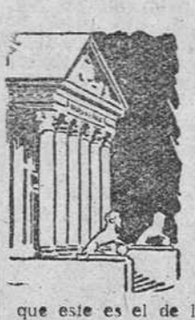
que este es el de los amables.

Fácil defensa de un letrado.—Gran exhibición del Real Madrid