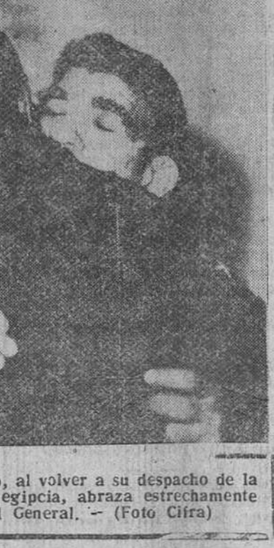
El Cairo. — El general Naguib, al volver a su despacho de la Presidencia de la República egipcia, abraza estrechamente a un oficial del Cuartel General.