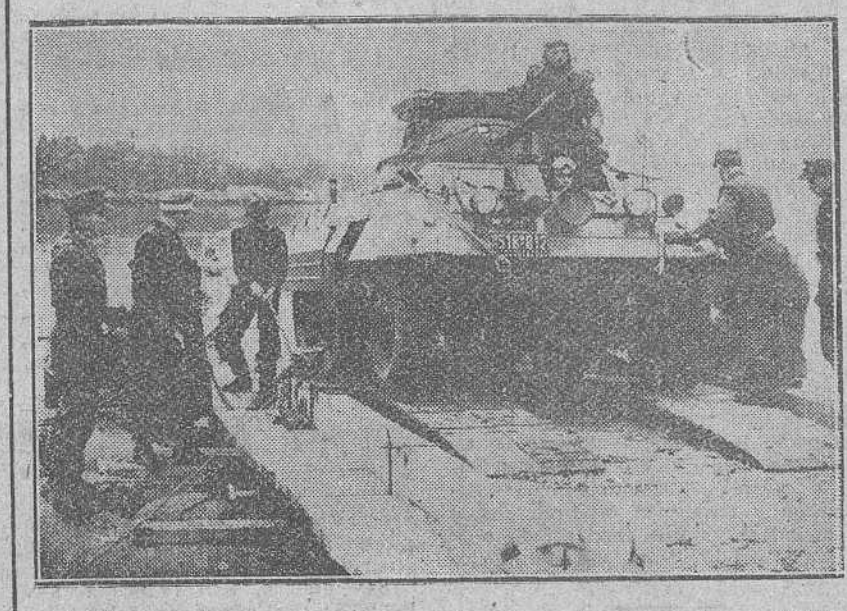
Un momento de las maniobras realizadas en Baviera por los miembros de la policía de fronteras de Alemania Occidental, en las que han participado doce mil hombres y dos mil quinientos vehículos. Este despliegue de fuerzas alemanas ha sido el mayor de los realizados por dicha policía, que cuenta cuatro años de antigüedad.