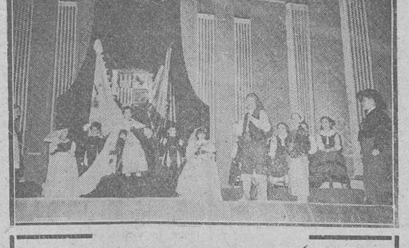
captó el domingo los precedentes grupos de intérpretes de las veladas celebradas el domingo por los Colegios de La Salle y Liceo Castilla, como iniciación de los actos de clausura del Año Mariano.