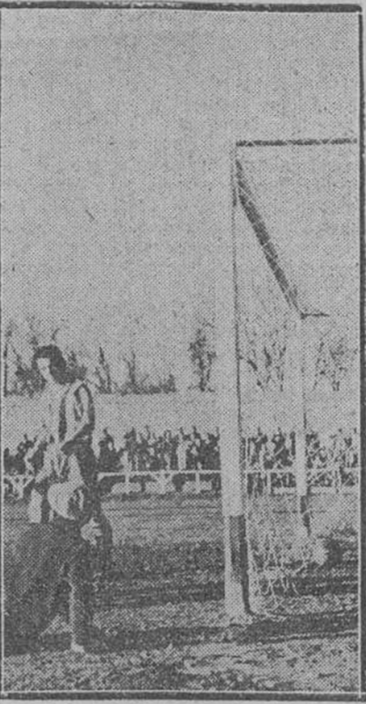
A poco del descanso, el Burgos empató así.

cuento con esos caracteres, pues hubo un avance que presagiaba el gol, pero se quedó en vicegol. Un espléndido pase de Brigido a Vilaseca provocó una situación de gran peligro, pero no pudo culminarse con el remate preciso. Este iba a ser un sintoma que iría acentuándose a medida que el tiempo transcurría. Se produjeron situaciones más claras aún, repitieron los avances—porque el Burgos mantuvo siempre la iniciativa—pero ni Lorente, ni Brigido tuvieron esa suerte que se precisa para lograr el gol.