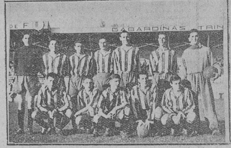
Equipo del Basconia, que llegó a Zatorre precedido de mucha fama, y que resultó batido por el Burgos por 3-1.