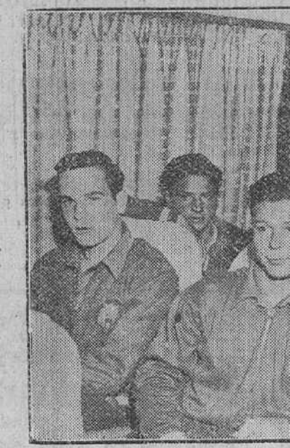
Madrid. — Los jugadores de la selección nacional de fútbol, que participará en el VII Torneo de Juveniles organizado por la F. I. F. A., fotografiados en el tren Taf, momentos antes de abandonar Madrid, camino de Alemania. En el torneo intervienen dieciocho naciones y las primeras eliminatorias se jugarán hoy sábado. El equipo español, adscrito al grupo B, con Portugal, Irlanda y Yugoslavia, no jugará hasta mañana domingo, enfrentándose a la selección yugoslava. El martes contendrá contra Irlanda y el 14 contra Portugal.