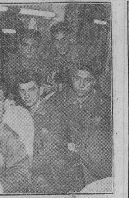
Madrid. — Los jugadores de la selección nacional de fútbol, que participará en el VII Torneo de Juveniles organizado por la F. I. F. A., fotografiados en el tren Taf, momentos antes de abandonar Madrid, camino de Alemania. En el torneo intervienen dieciocho naciones y las primeras eliminatorias se jugarán hoy sábado. El equipo español, adscrito al grupo B, con Portugal, Irlanda y Yugoslavia, no jugará hasta mañana domingo, enfrentándose a la selección yugoslava. El martes contendrá contra Irlanda y el 14 contra Portugal.

fesional y Técnica, habían acogido esta aspiración burgalesa cuya plena realización hoy se ve confirmada. La Orden aparecerá dentro de breves días en el "Boletín Oficial del Estado" y comenzará a regir a partir del próximo curso.