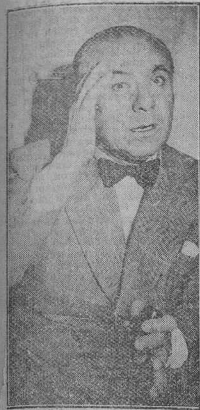
Madrid. — Un primer plano del famoso pianista español José Iturbi, durante la conferencia de Prensa celebrada en un centro hotel, a las pocas horas de su llegada a Madrid.