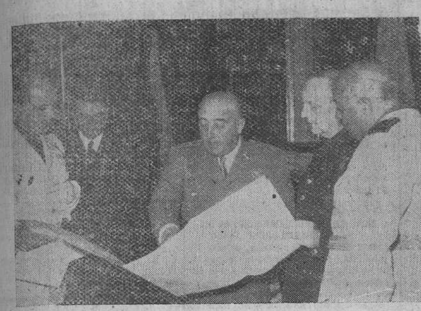
El Pardo. — S. E. el Jefe del Estado, durante la audiencia concedida a la comisión de jefes nacionales de las Obras Sindicales, acompañados del ministro Secretario General del Movimiento, señor Fernández Cuesta y del delegado nacional de Sindicatos, señor Solís.

De "caballo de Troya" califican en E. U. la propuesta rusa de adhesión a la N. A. T. O.