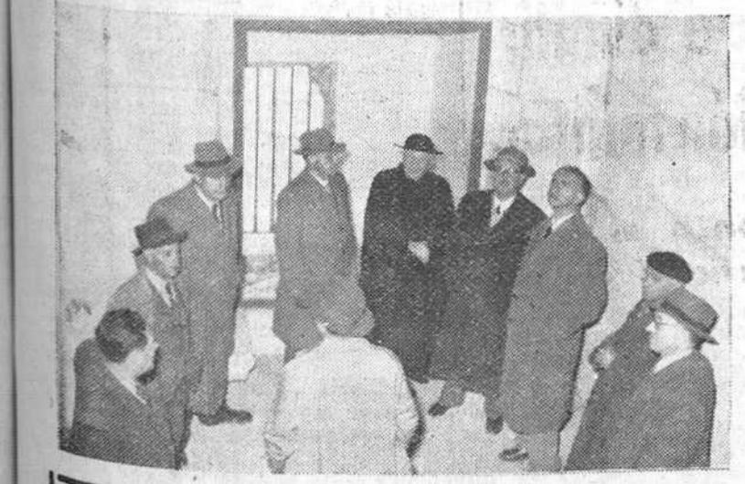
Ayer visitó diversos monumentos arquitectónicos de nuestra ciudad, acompañado de varias personalidades burgalesas, el comisario general del Patrimonio Artístico Nacional, don Francisco Iniguez, que aparece en nuestra fotografía (en cuarto lugar por la derecha), admirando las obras de restauración realizadas en la histórica "Casa de Miranda". (Foto Fede).