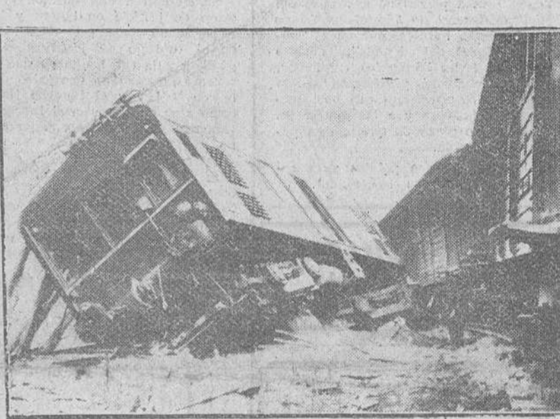
Bilbao. — Estado en que quedaron la locomotora y algunos de los coches del tren de viajeros, que descarriló entre Sestao y Ortuella, accidente en el que hubo que lamentar 21 heridos, varios de ellos graves.