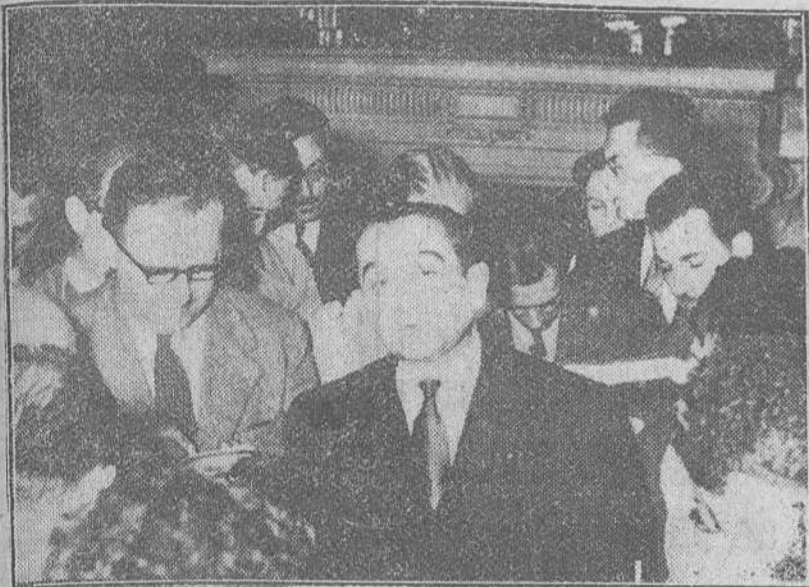
Paris. — El jefe del Gobierno francés, Mendes-France, conversando con los periodistas, antes de comenzar el debate en la Asamblea, sobre la Comunidad Europea de Defensa.

La negativa francesa -dice el secretario norteamericano- obliga a Estados Unidos a revisar su política exterior