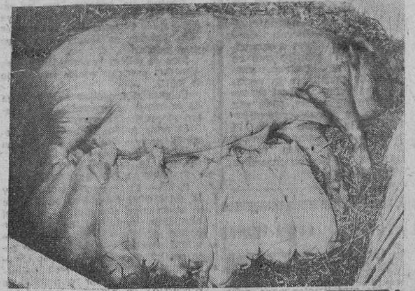
He aquí la fotografía de una cerda que haría dichoso a cualquier ganadero. Diez soberbios lechones aparecen amamantándose al mismo tiempo. Los sabrosos puercos, desde su nacimiento, ya tienen su sitio marcado: servir de alimento a los humanos.

Así tenemos, pues, la vida del cerdo en el "terrible" proceso hasta su sacrificio. Lo que es!