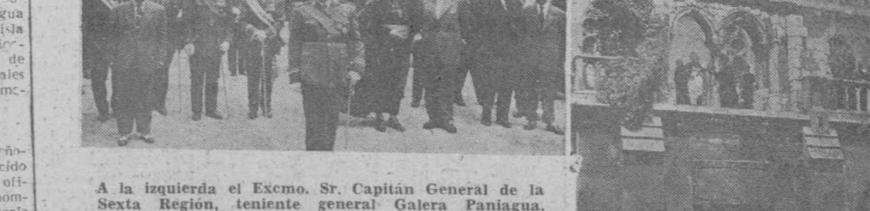
A la izquierda el Excmo. Sr. Capitán General de la Sexta Región...