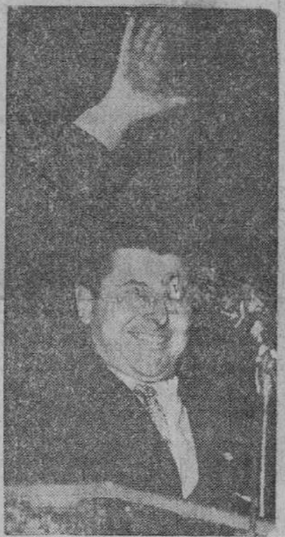
París. — Una reciente fotografía de Pierre Pujade, que dirige el movimiento que lleva su nombre, saludando a sus partidarios durante una reunión política. A la hora de redactar este "pie", Pujade tiene asegurados 50 puestos en la Asamblea Nacional y con probabilidades de alcanzar algunos más ya que faltan por cubrir 52. A pesar de su triunfo, ya que los técnicos le auguraban unos 14 puestos, no tiene probabilidades de gobernar.