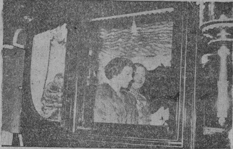
Copenhague. — Los Reyes de Dinamarca, con la Princesa heredera del Trono, se dirigen al Palacio Real donde los soberanos recibieron a las autoridades y personalidades del país que acudieron a felicitarles en el año nuevo.