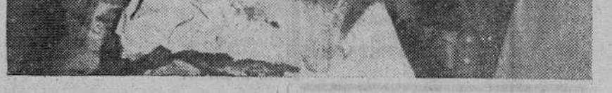
Un aspecto de la Exposición de artesanía "para ayuda al Hogar", montada por la Sección Femenina de Burgos, en la sala municipal de Arte y cuya Exposición está siendo visitadísima. En nuestra "foto" un grupo de visitantes contempla parte de las artísticas labores confeccionadas por señoritas de la Sección Femenina.