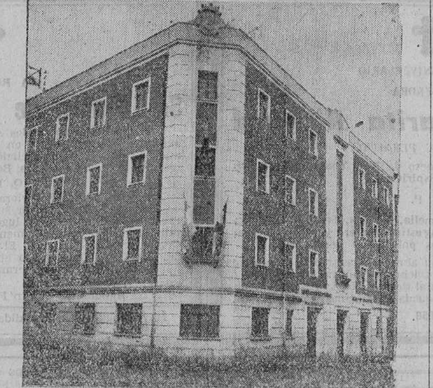
Aspecto exterior del magnífico grupo escolar "Hispano Argentino", que ha sido construido en el antiguo "Solar de Miñicas", en la confluencia de las calles de San Gil y Avellanosa, bendecido e inaugurado ayer, en un acto solemne.—(Foto Fede).

El laboratorio Noguchi dice el diario "Ashia - Chimbun", ha producido en Tokio azúcar de uva y el profesor Sasaki, de la Universidad de Kiushu, ha descubierto un procedimiento para fabricar el nuevo tejido que parece ofrecer ventajas sobre el nylon.—Efe.