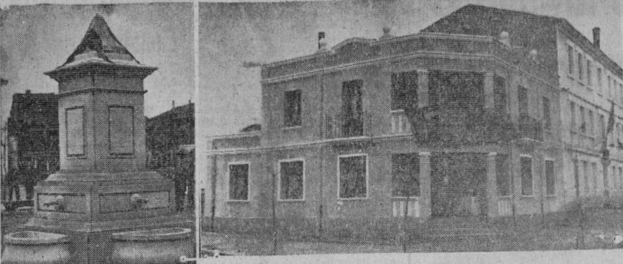
A la izquierda una de las fuentes del nuevo abastecimiento de aguas de Melgar de Fernamental y a la derecha, el Centro Rural de Higiene de Villasandino, obras que fueron bendecidas e inauguradas el pasado sábado, con asistencia del gobernador civil y otras autoridades provinciales.