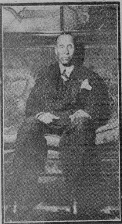
El Glaui que hizo una visita a Burgos en el año 1950, camino de Francia, posó para nuestros lectores en el hotel Condestable.

En las dos guerras mundiales fué un leal servidor de Francia