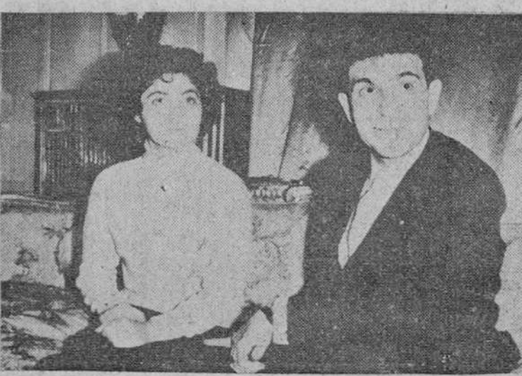
Teherán. — La hija única del Sha de Persia, princesa Shahnaz Pahlavi, con el príncipe heredero de Persia, Fazelah Zahedi, fotografiados en el palacio de la reina madre, el día que fue anunciado su compromiso matrimonial para el próximo mes de Noviembre. La princesa Shahnaz tiene 16 años y es hija del Sha y de su anterior esposa, la princesa Fawzia de Egipto.