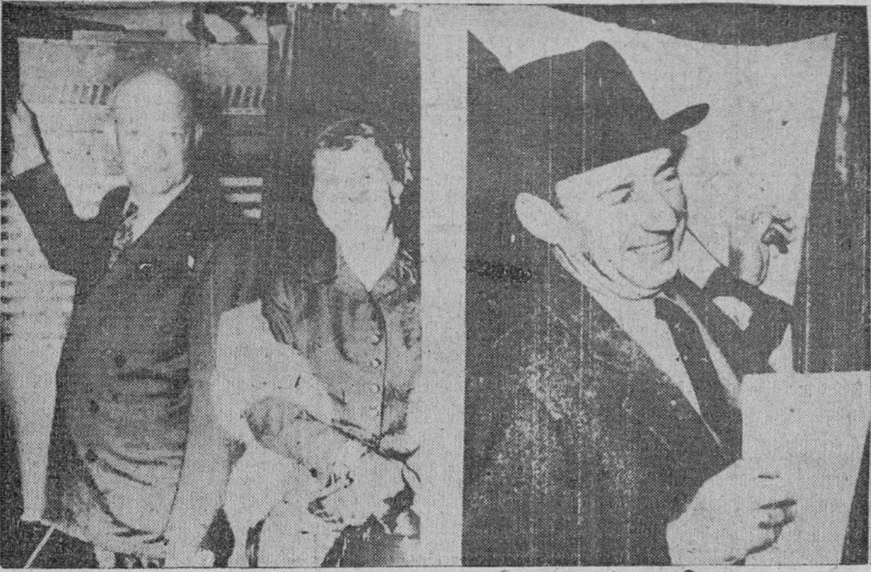
Una foto de hace cuatro años, que vuelve a cobrar actualidad. A la izquierda, el general Eisenhower, candidato republicano, acompañado de su esposa, disponiéndose a emitir su voto en Nueva York. A la derecha, Adlai Stevenson, candidato demócrata, al ir a votar en Libertyville (Illinois).

El vicepresidente actual hizo un primer recorrido por 32 Estados en los que, por espacio de dieciséis días, recorrió unos 22.000 kilómetros, celebró dos o tres conferencias. La Prensa en cada jornada, pronuncio unos cuarenta discursos de media hora de duración como mínimo, estrecho la mano de millares de norteamericanos y confidencia en todos y cada uno de los lugares que visitó. El ajetreo fue tal que en algún momento no sabía ni siquiera el sitio exacto en que se encontraba, lo que provocó las risas consiguientes cuando el auditorio advirtió la confusión, que por cierto puso en claro la esposa del candidato. Tras de un breve descanso, de nuevo emprendió la infatigable campaña que esta vez, le llevaría a otros 14 Estados, con un recorrido de 16.000 kilómetros, por espacio de once días. Stevenson y Kefauver no anduvieron menos activos. Los dos han viajado constantemente y uno y otro han aprovechado todas las oportunidades para dar y corresponderse de Prensa