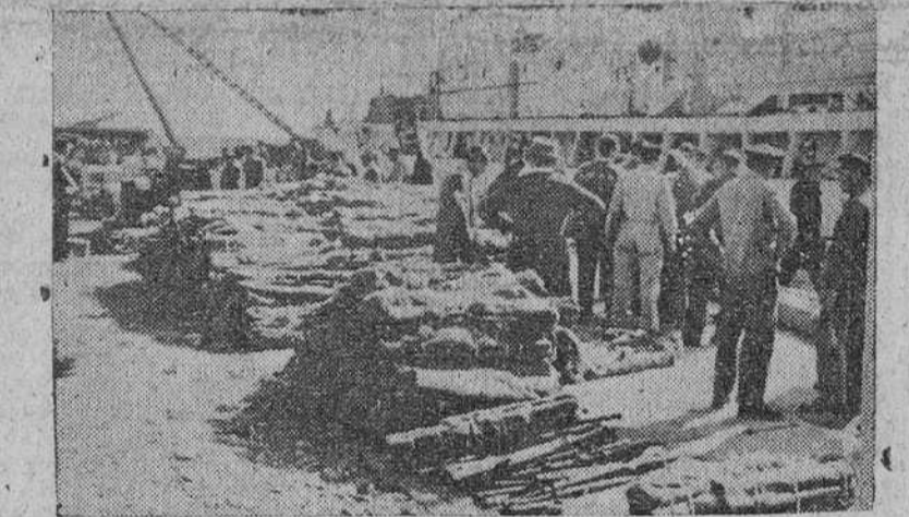
En el límite de las aguas territoriales argelino-marroquíes, un barco escolta francés apresó un navío contrabandista que transportaba setenta toneladas de armas y municiones destinadas a los rebeldes de Argelia. El barco-pirata "Athos" llevado a Mers-el-Kebir, cerca de Orán, fué inmediatamente desprovisto de su peligrosa carga.

Captura de un navío con 70 toneladas de armas para los fellaghas