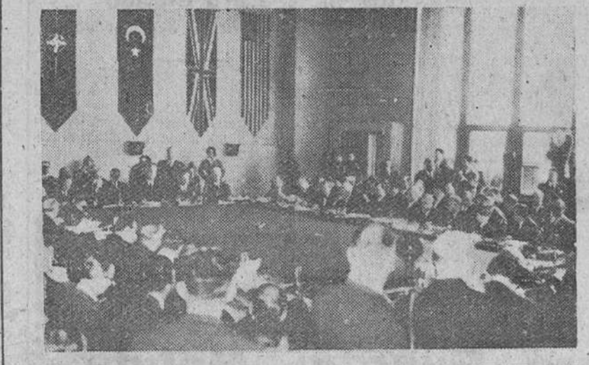
París. — Vista general del salón del Palacio de Chaillot durante la sesión de apertura del Consejo de la NATO, bajo la presidencia de Lord Ismay. — (Foto Cifra)