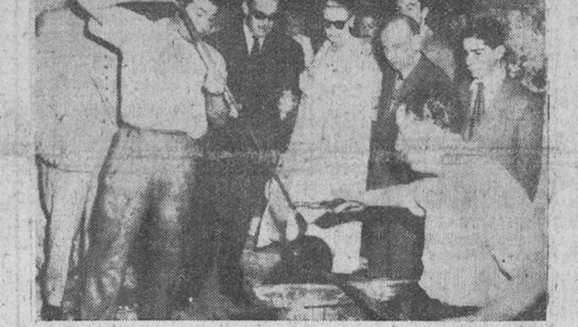
Palma de Mallorca. — La princesa Grace y el príncipe Rainiero, observan atentamente el trabajo de unos artesanos de cristal, durante la confección de un artístico vaso de cristal, con motivo de su visita a los establecimientos de artesanía de la isla.