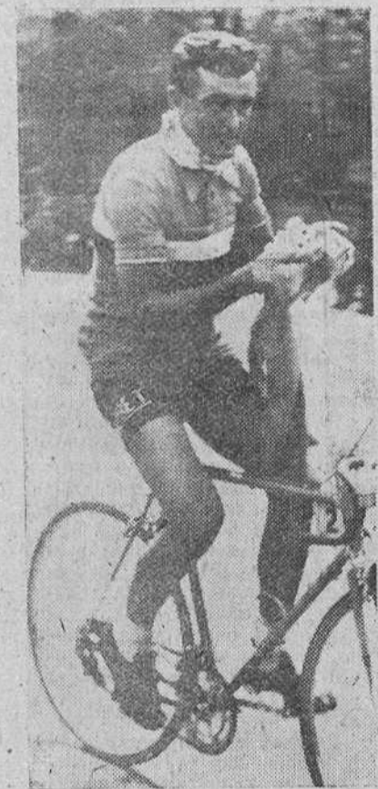
Louison Bobet, "as" del ciclismo mundial, triple vencedor del "Tour" de Francia y capitán del equipo galo que participa en la Vuelta a España, ha optado por abandonar, agotado, en la etapa de ayer. Su mayor le esperaba en Bayona y parece ser que al no encontrarse físicamente bien, se verá inclinado a no tomar parte en el "Giro" de Italia. Aquí aparece fotografiado a su llegada a Madrid, hace unos días.

Una gran carrera del italiano Astrúa, que venció netamente destacado en la meta de Bayona (Francio)