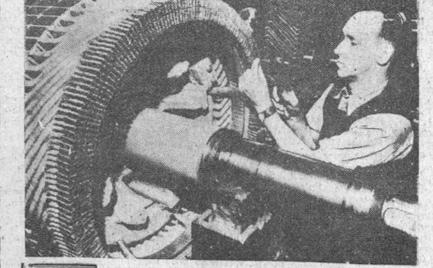
La nueva fibra sintética "Terylene" empleada profusamente en la confección de las últimas creaciones de la moda femenina. Se empieza a usar en gran escala en la industria textil. Aquí vemos a un operario de la General Electric aislando los inductores de un motor de 500 caballos con cinta tejida con "Terylene".