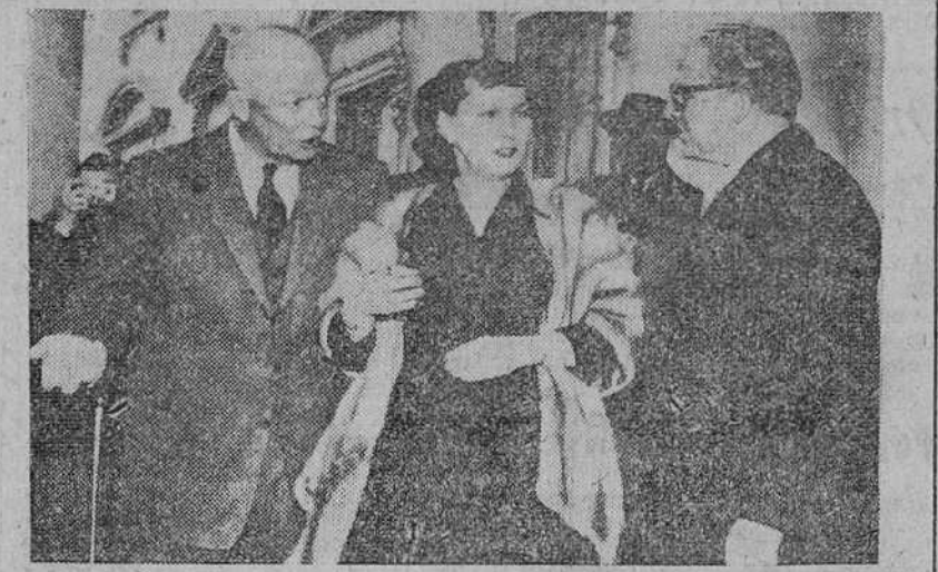
Washington. — El Presidente Eisenhower y su esposa, dan la bienvenida al Presidente italiano Giovanni Gronchi, a su llegada a la Casa Blanca. Es la primera vez en la Historia que un Presidente o jefe de Estado italiano visita los Estados Unidos.