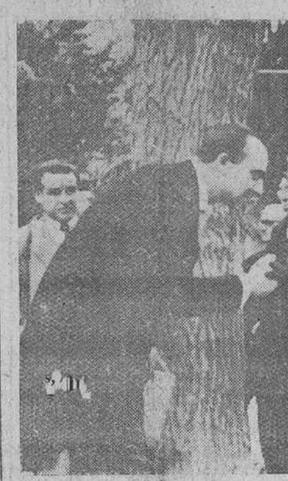
Murcia. — El subsecretario de Comercio, marqués de Miralrio, que presidió la inauguración de la III Feria Regional de Muestras celebrada en esta ciudad, saludando a la venerable madre del ingeniero La Cierza Codorniu, con ocasión del acto del descubrimiento de un busto a la memoria del invento de la alfombra.