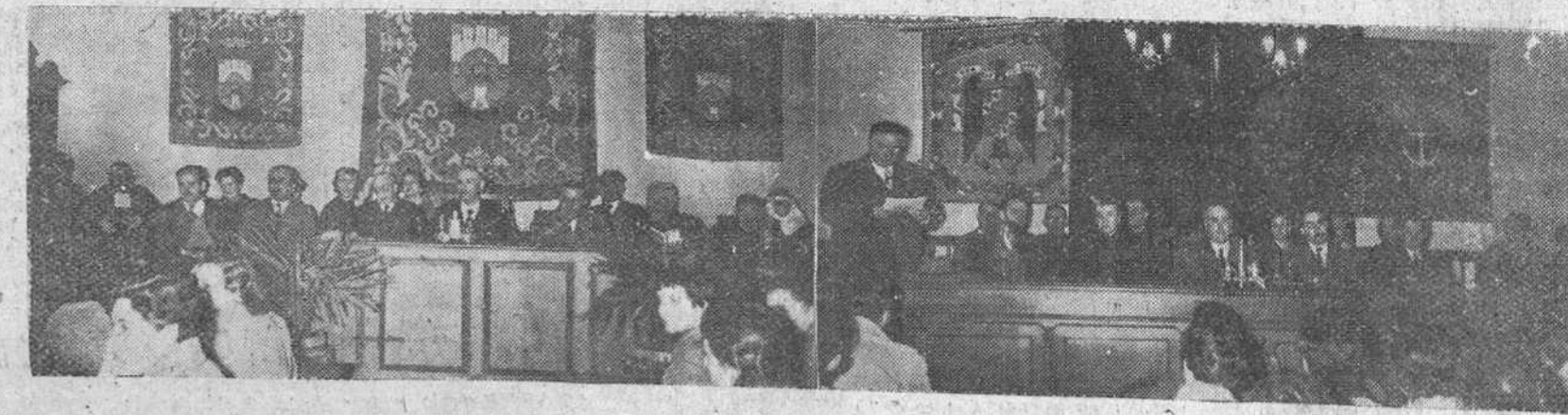
Presidencias de los solemnes actos académicos celebrados ayer en el Instituto de Enseñanza Media y en la Escuela de Comercio, en conmemoración de la "Fiesta del Libro".