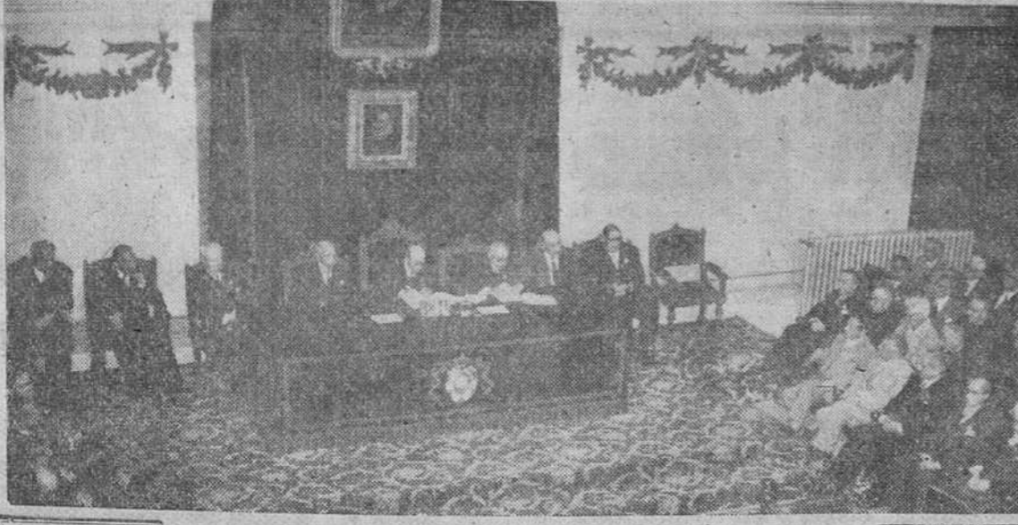
Madrid. — En el momento de la presentación de delegados y lectura del reglamento del Congreso, en la sesión preparatoria del Congreso de Academias de la Lengua celebrada en la mañana del domingo en la Real Academia Española. — (Foto Cifra)