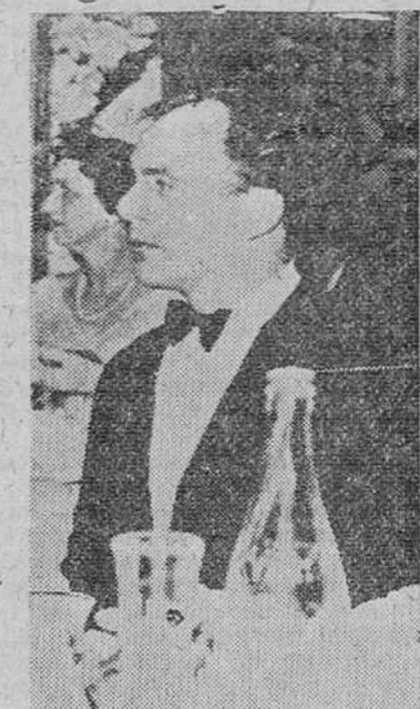
El príncipe Ali Khan, fotografiado en el Sporting Club de Montecarlo, en el curso de una fiesta organizada por el financiero griego Onassis.

Abierta a toda clase de enfermedades, excepto mentales e infecciosas, pueden ser asistidos por sus médicos de cabecera o especialistas.