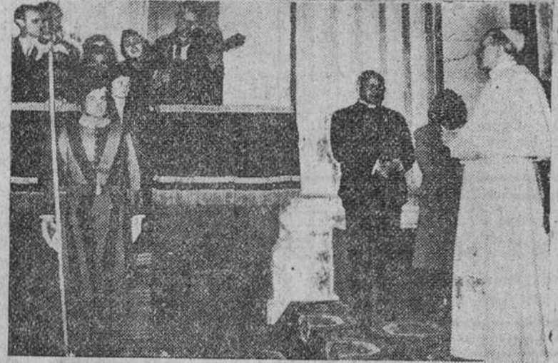
Ciudad del Vaticano. — Su Santidad Pío XII escucha la serenata que le dedica uno de los veinte peregrinos españoles, de la isla de Mallorca, que fueron recibidos en audiencia especial por Su Santidad. Otros miembros de dicha peregrinación también interpretaron ante Su Santidad canciones típicas mallorquinas.