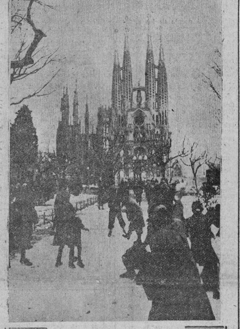
Barcelona. — Con gran contento de los niños ha nevado por tercera vez en esta capital, a lo que aquí vemos jugando con ella a la salida del colegio y en la Plaza de la Sagrada Familia.