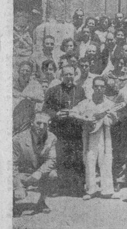
Los navarros residentes en nuestra ciudad, festejan a San Fermín

SAN FERMIN, EN PAMPLONA Pamplona. — Con tiempo caluroso y animación extraordinaria, han dado comienzo las fiestas de San Fermín. Poco después del amanecer, la banda norteamericana de la base de Torrejón de Ardoz, de Madrid, los gaiteros y los chistularis, recorrieron la ciudad interpretando alegres danzas. Seguidamente la multitud se ha dirigido a la plaza de toros y a las calles por donde había de pasar la torada, para asistir al espectáculo matutino del encierro, que se ha celebrado a las siete en punto, saltándose los toros de don