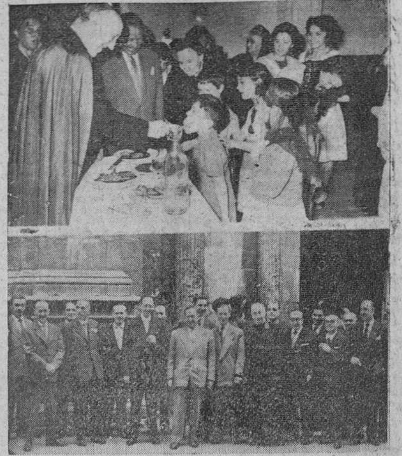
Con gran solemnidad se celebró ayer la fiesta titular de la iglesia parroquial de San Lorenzo el Real. En nuestro grabado recogemos dos aspectos de ella: en primer término, nuestro Rvmo. Prelado obsequiando a un pequeño durante el acto en que se ofreció a los pobres de la feligresía una comida extraordinaria. En la segunda placa, grupo de concurrentes a la ceremonia religiosa organizada con motivo de la conmemoración patronal de los funcionarios municipales.