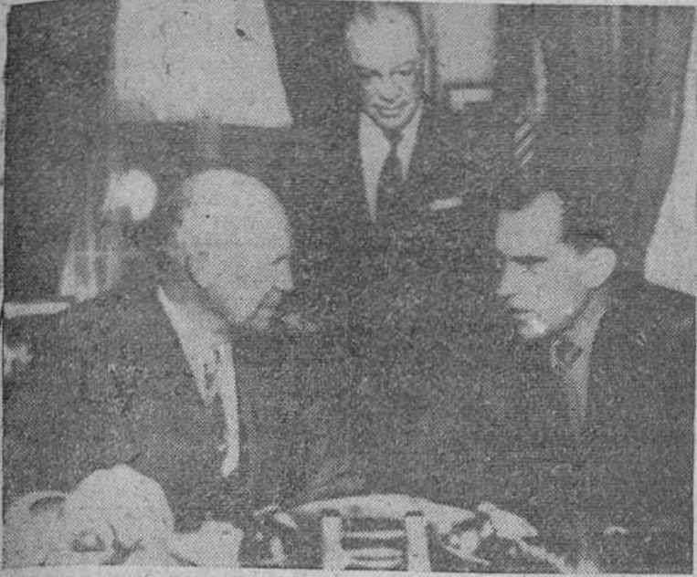
Washington. — Inmediatamente después de su llegada, el vicepresidente Nixon informa al presidente Eisenhower de su viaje de dos semanas por Rusia y Polonia. Detrás de ellos, el hermano del presidente, Milton Eisenhower, que acompañó a Nixon en su viaje.