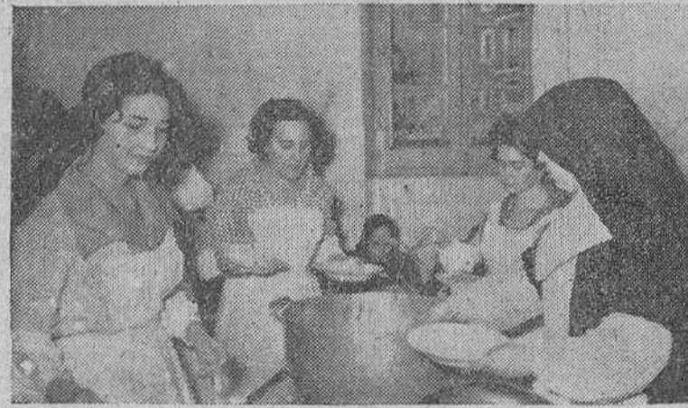
Un momento de la comida extraordinaria servida el domingo a los ancianos del Asilo de Hermanitas por madrinas, damas de honor y organizadores del XVI festival taurino en favor de dicho Centro, con motivo de la entrega del beneficio obtenido en el citado festejo, líquido que alcanza la suma de 75.317,57 pesetas.