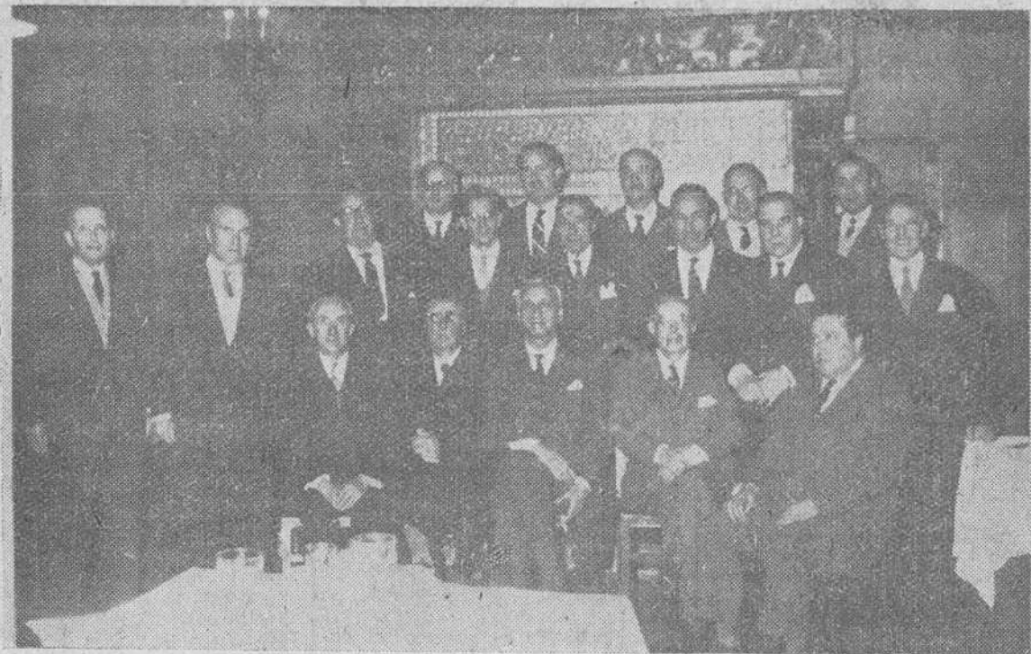
Con motivo de la toma de posesión de la nueva Junta del Salón de Recreo, se ha celebrado un almuerzo íntimo, a cuyo final los nuevos directivos, con los salientes, posaron para DIARIO DE BURGOS.