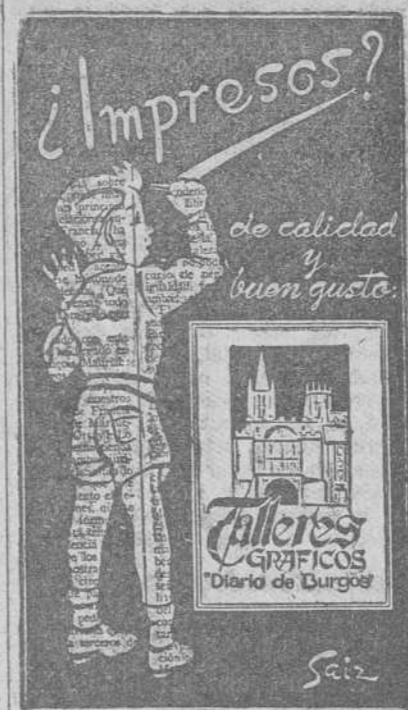
Talleres Gráficos "Diario de Burgos"

Ante esta incertidumbre esperamos tranquilamente el desarrollo de ese encuentro que se ha de celebrar el próximo domingo y que tanta expectación ha despertado en Plasencia.