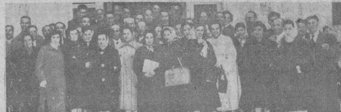
Grupo de Sacerdotes y Maestros del partido judicial de Miranda de Ebro, que ayer visitaron la Escuela de Agricultura establecida en Saldanuela.

Ellos, dirigentes sociales de primer orden, pregonaran el esfuerzo de la CAJA DE AHORROS MUNICIPAL por mejorar el agro y la ganaderia burgaleses.