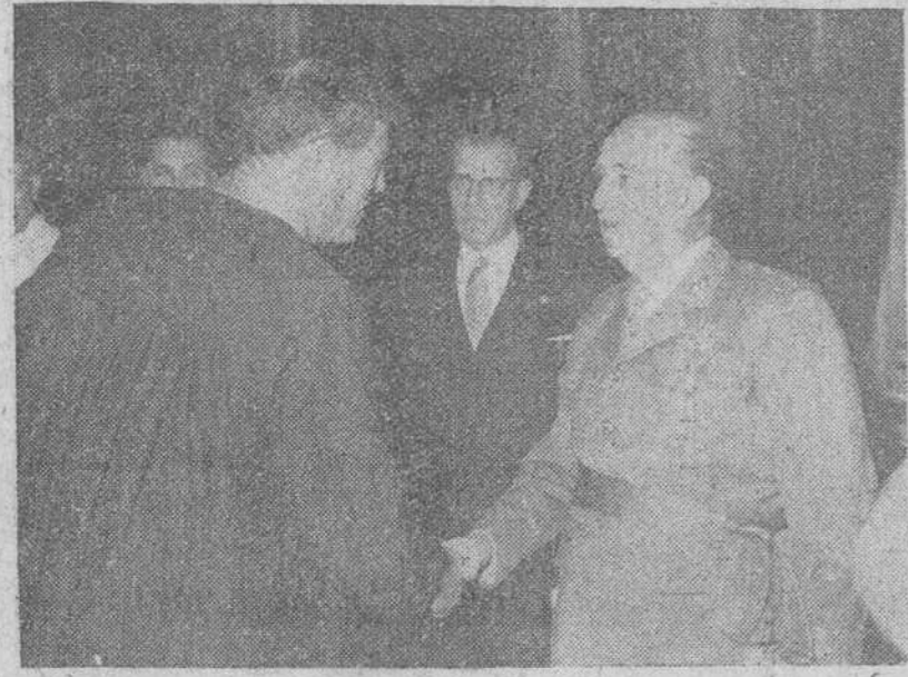
Madrid. — S. E. el Jefe del Estado durante la audiencia concedida a la comisión de agricultores de «La Puntá» (Valencia), presidida por el ministro de Agricultura y acompañada por las autoridades de la capital, que expresó al Caudillo su agradecimiento por la ayuda e interés prestado a raíz de la inundación de 1957.