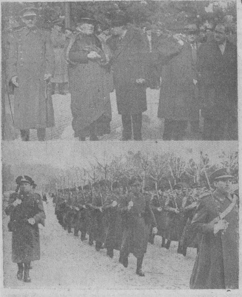
En las fotos: las autoridades presenciando el desfile de las fuerzas de la Policía Armada y la formación de éstas en un momento de su paso ante las personalidades que asistieron ayer a la fiesta patronal de los Cuerpos General de Policía y de Policía Armada y de Tráfico.

Ayer, a las doce, con la solemnidad de costumbre, celebraron los Cuerpos General de Policía y de Policía Armada y de Tráfico la fiesta de su patrono, el Santo Angel de la Guarda.