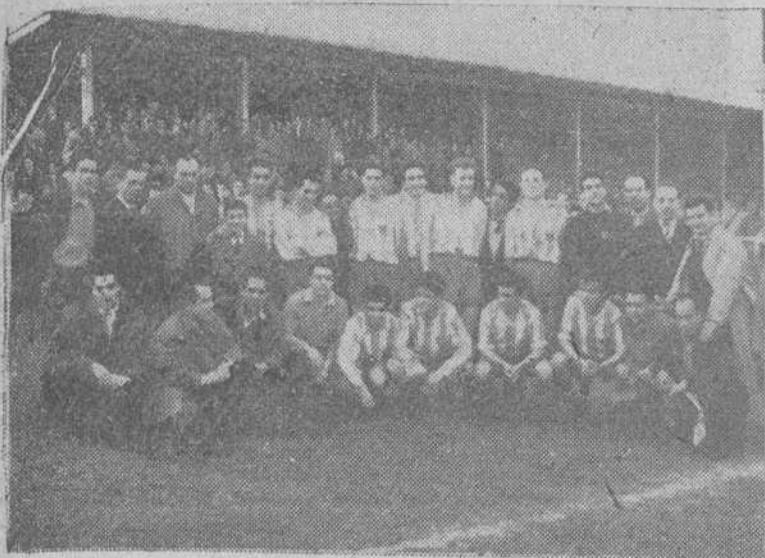
He aquí el equipo del Mirandés F. C., alineado el domingo y que ganando en Anduva, ha ascendido a Primera Categoría Regional, de la Federación Navarra.

Eibar.—Por dos tantos a uno, el equipo titular ha batido el domingo al Deportivo Mirandés, en partido de Tercera División (cuarto grupo).