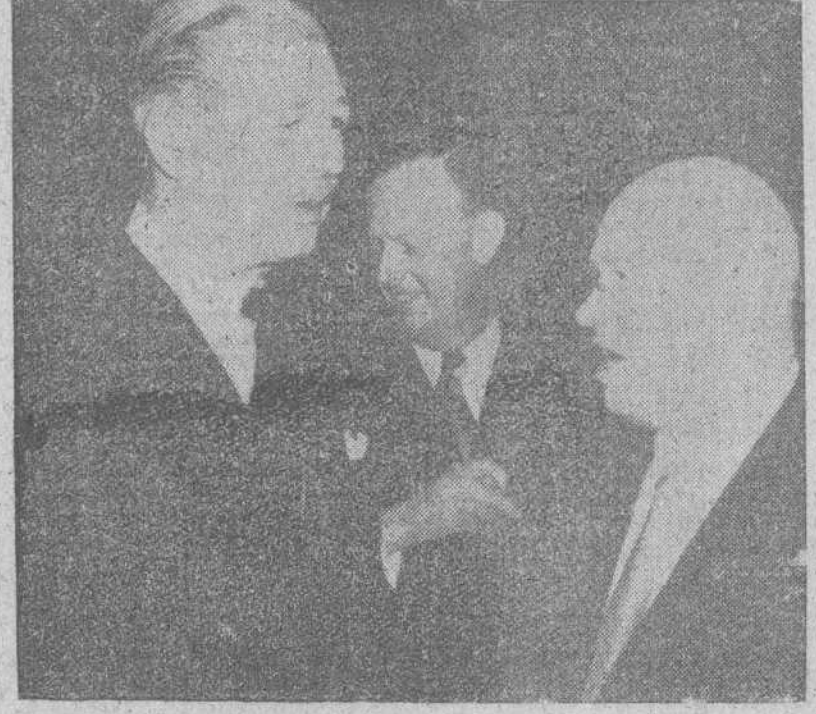
MOSCÚ. — Mac Millan y Kruschef conversando en la Embajada británica en Moscú, durante la estancia del «premier» inglés en la capital rusa.

con Inglaterra y Francia, pues se trata de equipararlas a aquellas. También se cree en los círculos diplomáticos que la insistencia de Moscú sobre la presencia de sus dos satélites cuando de conferencia de máximo nivel se trate.—Efe.