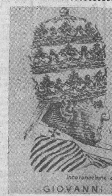
Nueva emisión de sellos del Vaticano

Madrid. — Esta tarde han llegado a Madrid el inspector general de Finanzas de Francia y presidente de la Comisión de expertos que laboró la reforma financiera de Diciembre de 1958, M. Jacques Rueff. Poco después de su llegada acudió a la Delegación Nacional de Sindicatos, donde matuvo una entrevista con el ministro, señor Solís. A continuación, el señor Rueff sostuvo una conferencia con los representantes de la Prensa madrileña. Comenzó mostrando su reconocimiento a la invitación que le había hecho el señor Solís, prueba evidente de la atención con que en España se siguen los acontecimientos económicos de Francia. En primer lugar dijo que quería hacer una importante aclaración: que no venía a dar consejos ni a divulgar opiniones, por que no conoce la situación de España. Tampoco quería poner como ejemplo lo hecho en Francia ya que la situación y los procedimientos varían en cada país. Sólo iba a tratar de las medidas implantadas en Francia y de grado de desarrollo. Manifestó que Francia había obtenido en los últimos años un gran aumento de la natalidad, hasta el punto de que se está transformando de un país viejo en un país joven.