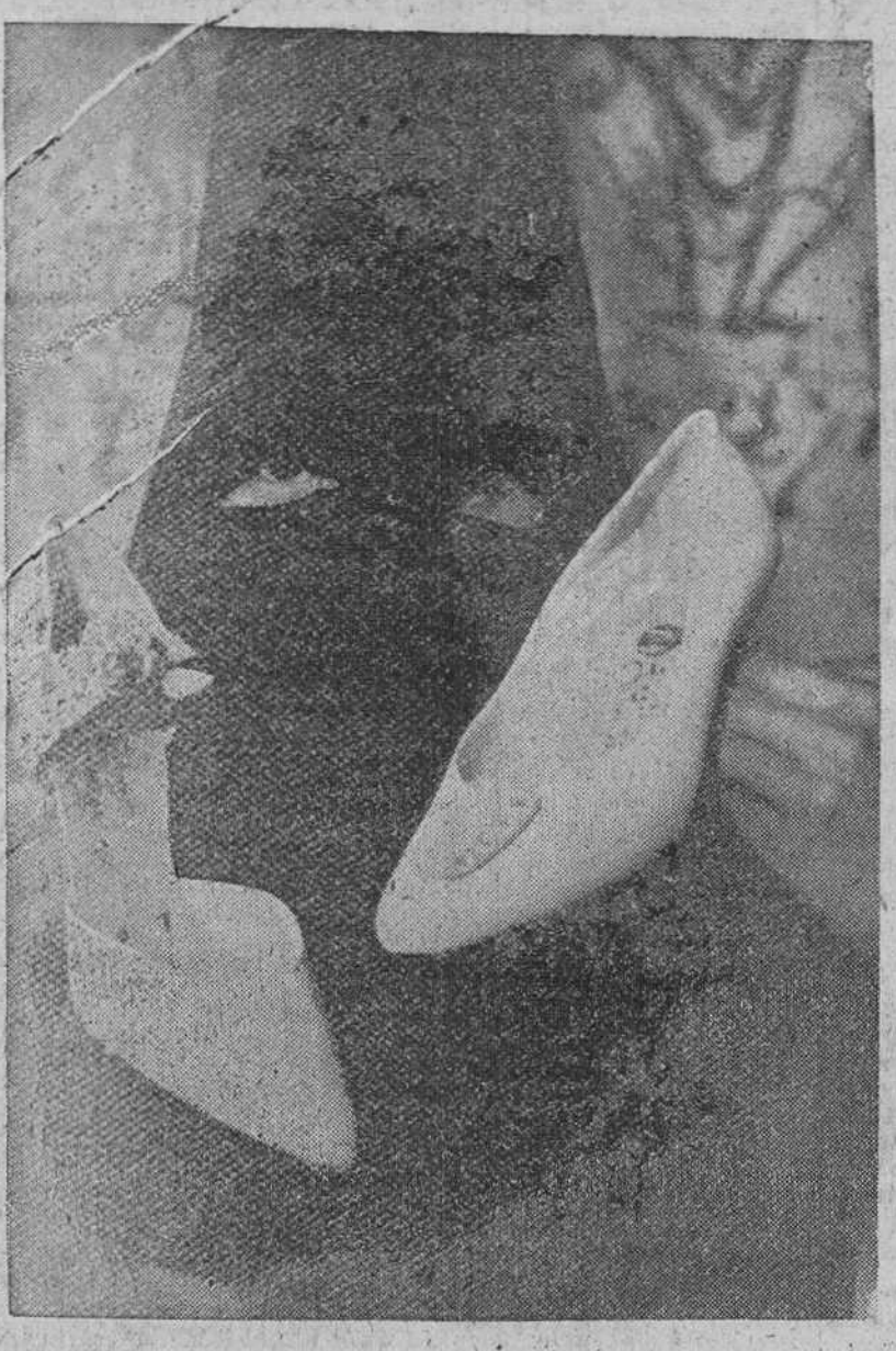
Han sido presentados en París los nuevos calzados bajo el nombre de "doble juego" que ha hecho salir tres nuevas tendencias...