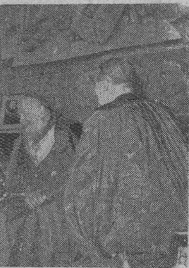
Madrid.—S. E. el Jefe del Estado durante la audiencia concedida al Cardenal Tisserant, decano del Sacro Colegio Cardenalicio. Durante la entrevista, estuvieron presentes el ministro de Asuntos Exteriores, señor Castiella y el Nuncio de Su Santidad, Monseñor Antonutti.

Palma de Mallorca.—En avión militar, procedente de Madrid, ha llegado el ministro del Ejército, teniente general Barroso.