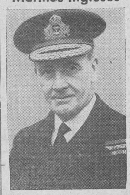
Almirante, Sir James Fownes Somerville, comandante en jefe de la flota inglesa en Occidente

Infancia, domiciliado en Ginebra, se ha dirigido a la representación diplomática de España, pidiendo amplia información sobre la edad y la nacionalidad de los niños que el Gobierno español ha invitado a invernar en España, con especial indicación del lugar en donde serían albergados dichos niños y la probable duración de su estancia en España.—Efe.