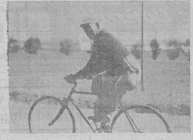
Sobre su máquina — primitiva y ya un tanto anticuada — el más veterano ciclista de España sonríe a nuestro fotógrafo, en plena marcha el día que participó en la popular carrera organizada por el Club Ciclista

Esta es, en síntesis, la estampa del más veterano deportista burgalés, al