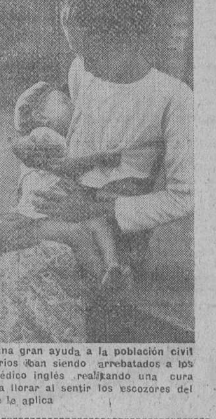
Las autoridades aliadas prestaban una gran ayuda a la población civil birmana, a medida que éstos territorios iban siendo arrebatados a los nipones. Aquí se ve a un oficial médico inglés realizando una cura a un pequeño que rompe a llorar al sentir los escozores del líquido que se le aplica