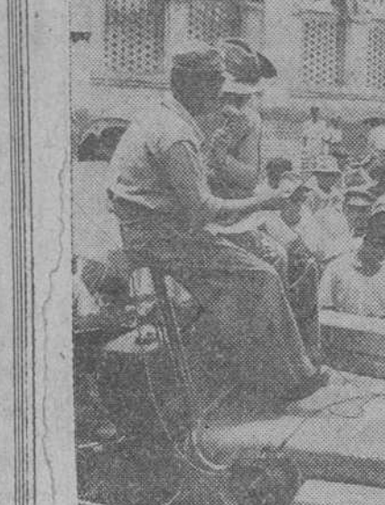
En una plaza pública de Mandalya, estos soldados ingleses han establecido su estación emisora en un "eep" ocupado con altavoces desde los cuales transmiten instrucciones a la población indígena que curiosamente rodea el pequeño vehículo.