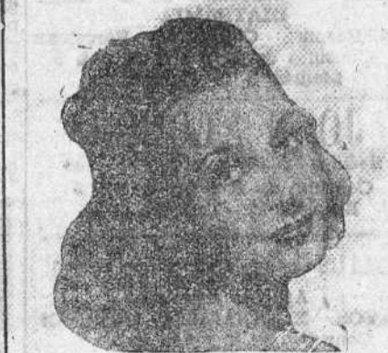
Luchi Soto Hoy en la pantalla, mañana en la escena del Principal y siempre bonita y notable actriz.