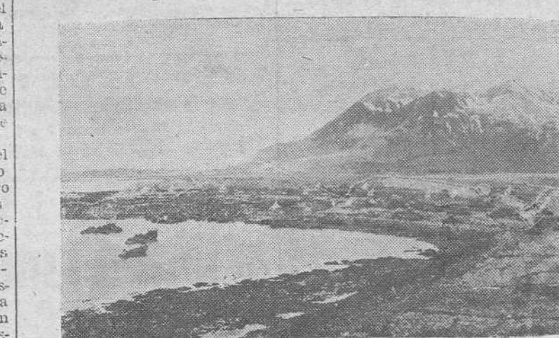
Los batallones de construcción de la Armada Norteamericana han establecido rápidamente una base americana en la Isla de Attu. He aquí el campamento instalado en las orillas de la isla