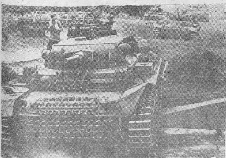
Una sección de tanques alemanes rodea una posición montañesa ocupada por los soviets