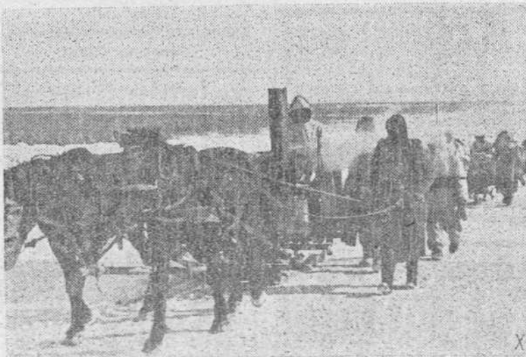
Bajo los rigores del cruento invierno, los soldados alemanes transportan sobre trineos las cocinas de campaña que llevarán el rancho caliente a las primeras líneas