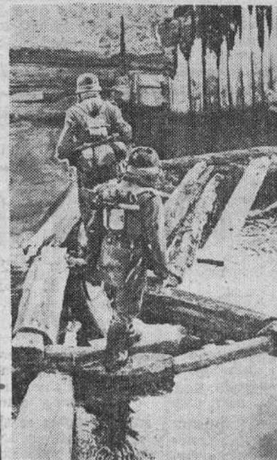
Este puente fué destruido por las bandas soviéticas y los soldados del Reich improvisan bien pronto una pasarela para establecer la comunicación entre las dos orillas