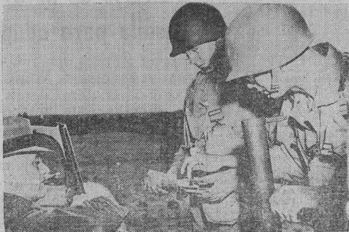
Dos oficiales muestran al Presidente Roosevelt las piezas activas del "bazooka", la nueva arma americana, destructora de tanques.