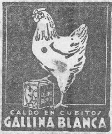
CALDO EN CUBITO GALLINA BLANCA

Augurando grandes éxitos a tan feliz compañía les damos nuestra más cordial enhorabuena.