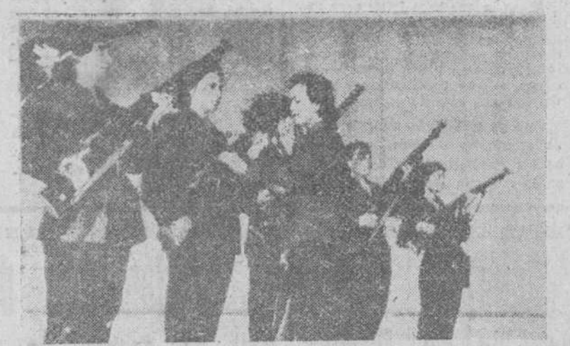
El Cairo. — Miembros del partido Iemenino “Ben El-Nil” con sus uniformes azules, durante las prácticas de tiro y manejo del rifle, efectuadas en la zona Este del desierto, próxima a esta ciudad.