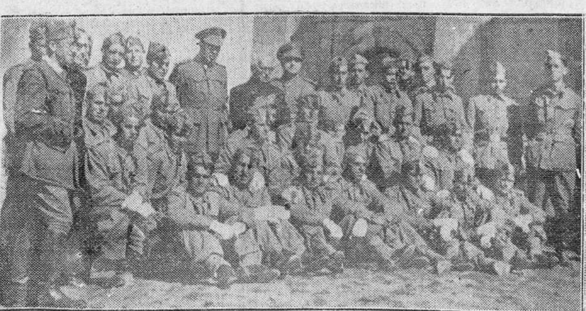
Grupo de soldados del Regimiento de Infantería San Marcial que recibieron ayer la primera comunión en el campamento de Cubillo del Campo, presididos por el coronel, teniente vicario de la Región y otros varios jefes y oficiales.