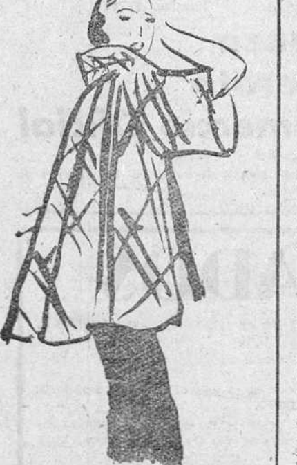
Abriego de lana escocesa verde y negro (Creación Grés)

ris es realmente insostenible, porque parece ser que estamos a 30 grados, contemplamos estocicamente, en salones llenos de una multitud sudorosa, los desfiles de maniqués, envueltas en magníficos abrigos de pieles, como para pasearse a pie por la cima del Himalaya. Pero, que quieren ustedes, amigas lectoras! Estas son las quebras de nuestra profesión, que, por otra parte, es divertida y llena de interés.