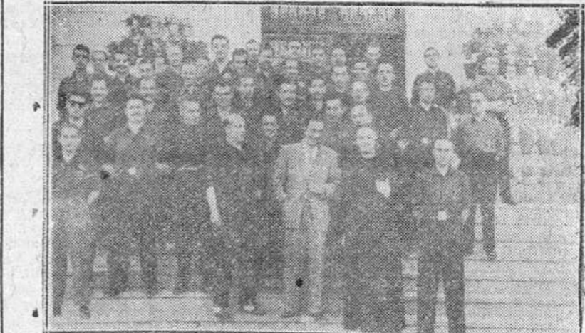
Se ha iniciado en nuestra ciudad, el segundo, curso nacional de lugartenientes de la Guardia de Franco, en Burgos