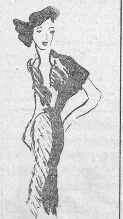
Vestido de alpaca gris antracita (Creación Cristian Dior)

Los trajes sastre de esta colección, son muy ceñidos en la chaqueta, y llevan casi todos cuello de terciopelo. Las faldas aparecen sensiblemente más largas, aunque, paradójicamente,