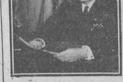
Washington.— El presidente Truman ha leído el "mensaje sobre el Estado de la Unión", ante las dos Cámaras del Congreso norteamericano, que inician ahora su mandato. El presidente bosquejó un programa de diez puntos para preservar la paz mediante el fortalecimiento del mundo libre, cosa necesaria porque "la agresión en Corea forma parte de la tentativa de la dictadura comunista rusa de apoderarse del mundo libre a paso".

Washington.— El presidente Truman ha leído el "mensaje sobre el Estado de la Unión", ante las dos Cámaras del Congreso norteamericano, que inician ahora su mandato. El presidente bosquejó un programa de diez puntos para preservar la paz mediante el fortalecimiento del mundo libre, cosa necesaria porque "la agresión en Corea forma parte de la tentativa de la dictadura comunista rusa de apoderarse del mundo libre a paso". Afirmó que "las fuerzas de las naciones libres son la mejor esperanza de paz del mundo". Este mensaje de Truman es el que tradicionalmente pronuncian los presidentes al inaugurar sus sesiones las nuevas legislaturas. Tiene como objeto diseñar la nueva legislación sobre asuntos nacionales y extranjeros de que se deberá ocupar el Congreso. Sin embargo, excepcionalmente, el presidente dedicó la mayor parte del mensaje a tratar de la situación internacional creada por la amenaza de agresión comunista.