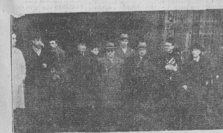
PERSONALIDADES QUE PRESIDIERON LA MISA CELEBRADA EL PASADO DOMINGO EN LA IGLESIA DE LA MERCED POR LAS CAJAS DE AHORROS BENEFICAS CON MOTIVO DE LA FIESTA DE LA SAGRADA FAMILIA, PATRONA DE DICHAS INSTITUCIONES, FOTOGRAFIADAS A LA SALIDA DE DICHO TEMPLO.