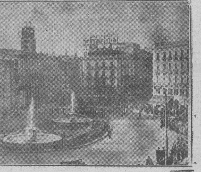
UNA VISTA DE LA PUERTA DEL SOL, DESPUES DE SER INAUGURADAS LAS FUENTES CONSTRUIDAS EN MEDIO DE LA POPULAR PLAZA MADRILEÑA.