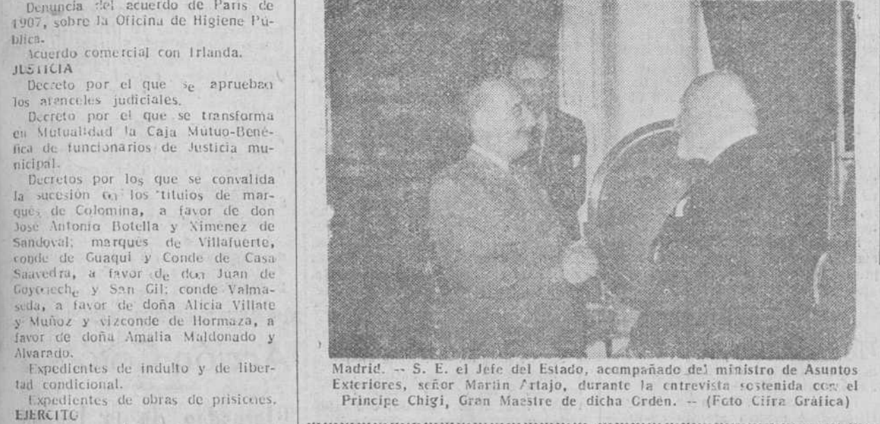
Madrid.— S. E. el Jefe del Estado, acompañado del ministro de Asuntos Exteriores, señor Martín Artajo, durante la entrevista sostenida con el Príncipe Chigi, Gran Maestro de dicha Orden.