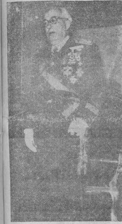
El teniente general Yagüe, presidente, desde su trono, la solemne recepción celebrada ayer, a mediodía, en Capitanía General, con motivo del "Día del Caudillo".