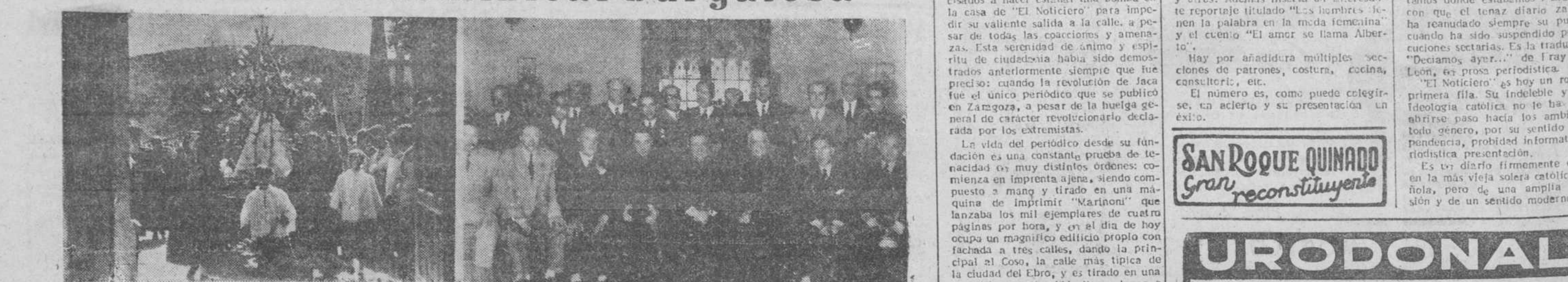
En nuestros grabados: a la izquierda, un momento de la romería (poca caste llana celebrada en Revenga, con participación del Orfeón Burgales; a la derecha grupo de micromoros de la Cofradía de Jesús Crucificado y del Santísimo Sacramento, reunidos en la jornada final del solemnisimo triduo celebrado en la iglesia de San Lesmes.