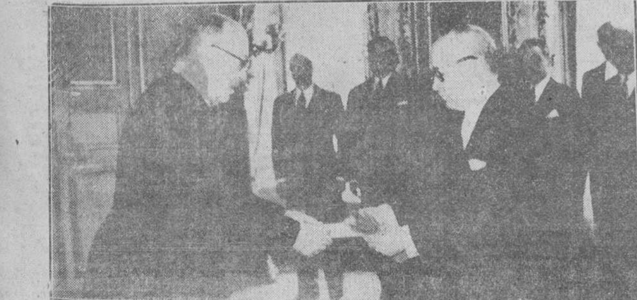
EL EMBAJADOR ESPAÑOL EN FRANCIA PRESENTA SUS CARTAS CREDENCIALES AL PRESIDENTE DE LA REPUBLICA FRANCESA, VICENT AURIOL.