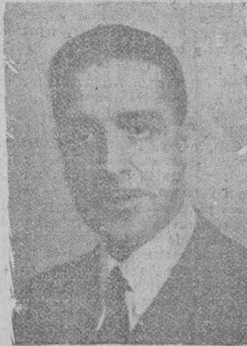
EL MINISTRO DE HACIENDA

Madrid.—En la Escuela naval de Guerra se ha celebrado esta mañana la entrega de los despachos a ocho jefes y oficiales que han terminado sus estudios de especialistas de Estado Mayor de la Armada.