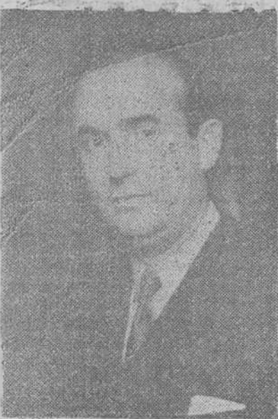
EL MINISTRO DE COMERCIO

Seis miembros del Gobierno prestaron juramento como procuradores en la sesión plenaria de ayer