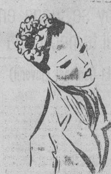
Gorrita de paja negra adornada con geranios (Creación Paulette)

ya punta viene a sombrear la frente y también se ven gorritos pequeños que recuerdan los que llevaban las niñas del Renacimiento, a veces bordeados con un grueso burlete de muselina.