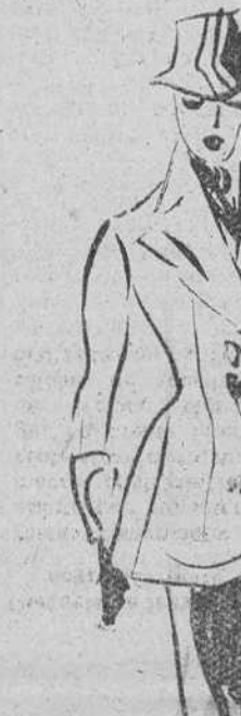
Chaqueta de lana color miel, con falda negra (Creación Cristían Dior)

PARIS. Abril.—(Exclusivo para nuestro periódico). Estamos ya llegando al florido mes de Mayo, mes que en todo el universo católico se dedica a celebrar las pri-