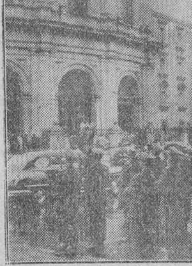
Solemnes funerales en San Francisco el Grande.

Londres. — El Consejo de la Federación de Sindicatos, que cuenta con unos ocho millones de afiliados, ha publicado una declaración en la que apoya la política de rearme defendida por el Gobierno.