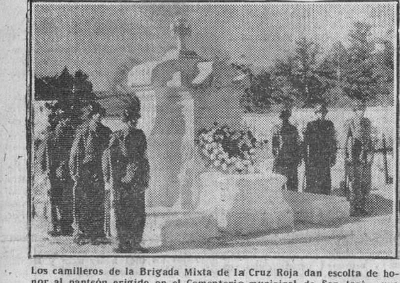
Los camareros de la Brigada Mixta de la Cruz Roja dan escolta de honor al panteón erigido en el Cementerio municipal de San José, cuyo acto de bendición se verificó el domingo último.