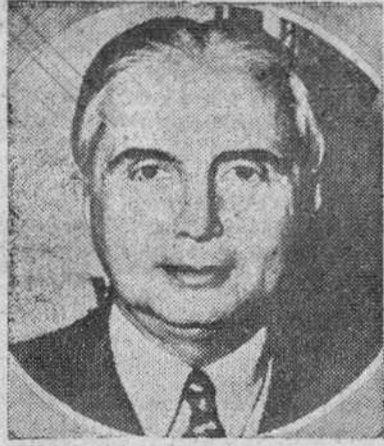
EL PRESIDENTE OSPINA

OSPINA ANUNCIA SIN EMBARGO QUE LAS ELECCIONES SE CELEBRARAN EL PROXIMO DIA 26