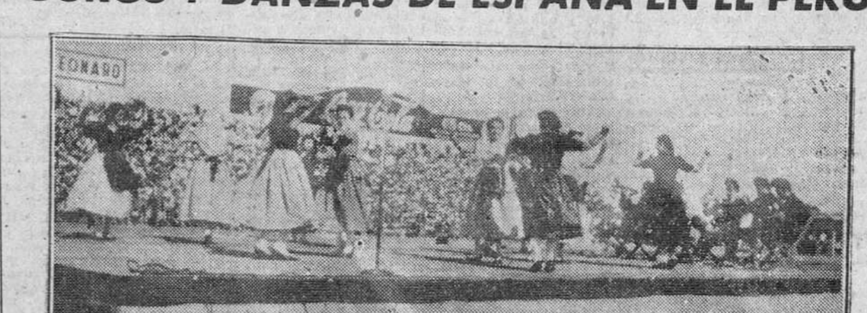
Lima.—En el Estadio nacional de la ciudad, las muchachas españolas muestran su arte folklórico ante más de treinta mil espectadores.